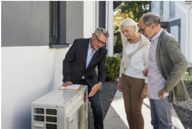
Wärmepumpen heizen kostengünstig.