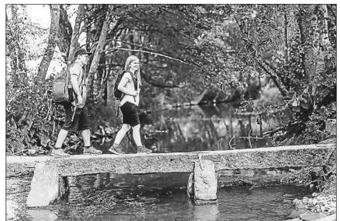
Entdecke deine Heimat neu

Der Heimat entdecken Newsletter präsentiert dir einmal in der Woche die schönsten Seiten von Baden-Württemberg. Werde selbst aktiv zum Heimatentdecker, lese die neuesten Artikel auf LOKALMATADOR.DE, tauche ein in die Nussbaum Erlebniswelt und lerne das Land von ganz neuen Seiten kennen. Als Nussbaum Club-Mitglied sparst du dabei sogar. Jetzt kostenlos anmelden unter https://www.lokalmatador.de/newsletter .