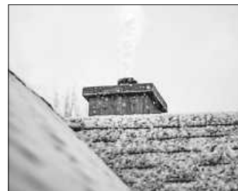
Das Heizen mit Gas wird in den kommenden Jahren immer unwirtschaftlicher werden

2025 beginnt für viele Familien mit steigenden Kosten für ein warmes Zuhause. Diese Entwicklung wird sich auch in den kommenden Jahren fortsetzen. Ursache dafür sind vor allem die angehobenen Netzentgelte für Gasanschlüsse. Dafür gibt es einen plausiblen, für Kunden:innen aber nicht ersichtlichen Grund.