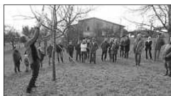
Aufmerksam wird dem Schnitt zugeschaut

Streuobstwiesen sind für unsere Landschaft prägend. Zum Erhalt ist die Pflege äußerst wichtig. Dazu gehört auch der Winterschnitt. Wir, der Obst und Gartenbauverein Kleiningersheim ladet SIE Alle ein, am Samstag 8.