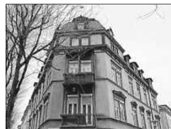
Energetische Sanierungen sind trotz Denkmalschutz machbar und sinnvoll

Mit dem Denkmalschutz werden kulturelles Erbe und architektonische Vielfalt bewahrt. Um dem Klimaschutz gerecht zu werden, müssen aber auch diese Gebäude energetisch aufgewertet und mit erneuerbaren Energiequellen ausgestattet werden. Bei der Sanierung sollte beachtet werden, dass die Belange des Denkmalschutzes über anderen gesetzlichen Anforderungen stehen können. Glücklicherweise gibt es technische und kreative Lösungen, um Denkmal- und Klimaschutz zu vereinen.