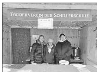
Vorstand des Fördervereins

Am Stand wurde Glühwein, hausgemachter Kinderpunsch und Pizza geboten. Alle kleinen und großen Besucher konnten am Stand kreativ sein und Weihnachtsanhänger aus Salzteig für den Weihnachtsbaum gestalten. Pizzaduft und Basterei lockten viele Adventsmarktbesucher an, so dass rund um die Bude eine gemütliche Atmosphäre herrschte und ein reger Austausch stattfand. Wir danken allen Besuchern für das Vorbeikommen und allen tatkräftigen Eltern fürs Helfen und Mitwirken.