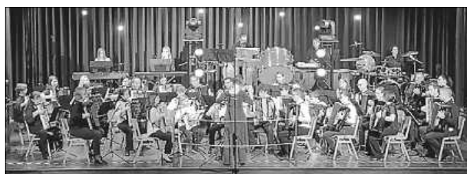
Das 1. Orchester und die Funny Tasten bei der Zugabe

Beim Auftaktstück des 1. Orchesters „Totems“ konnte man sich fragen, was das mit dem Motto zu tun hat. Der Komponist Ian Watson nimmt darin Bezug auf die Kunstinstallation gleichen Namens auf der Halde Haniel in Bottrop, das aus alten Eisenbahnschwellen besteht, die wie Totempfähle aufgestellt sind. Ein Stück, das mal sehr pompös, aber auch mal sehr ruhig daher kommt und für Gänsehaut-Momente sorgte. Unterhaltsam wurde es bei „Take the A-Train“, „Starlight-Express“ und dem „Chattanooga Choo Choo“, bei dem so mancher im Publikum mitschwangte. Zur Zugabe „City of New Orleans“ stießen die „Funny Tasten“ noch einmal zum 1. Orchester dazu und gemeinsam entließen sie ein begeistertes Publikum nach einem unterhaltsamen Abend. Rund um die Musikdarbietungen wurden die Anwesenden wie immer von Mitgliedern des Bläserorchesters Ingersheim bestens mit Speis und Trank versorgt. Ein herzliches Dankeschön dafür!