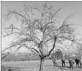
Ein alter Obstbaum vor dem Schnitt

Obstbaumwinterschnitt war am 8. Februar 2025 um 13.00 Uhr auf dem Lindenhof