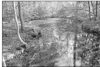
April 2018; wer weiß, wo das ist?