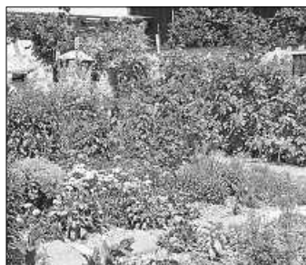
Im Staudengarten blüht über die warme Jahreszeit immer etwas