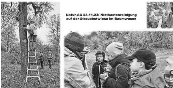
Natur-AG 23.11.23: Nistkastenreinigung auf der Streuobstwiese im Baumwäsen

der Nistkästen an. Es ist immer spannend zu sehen, welche Nistkästen belegt sind und ob erkennbar ist, dass Jungvögel groß geworden sind.