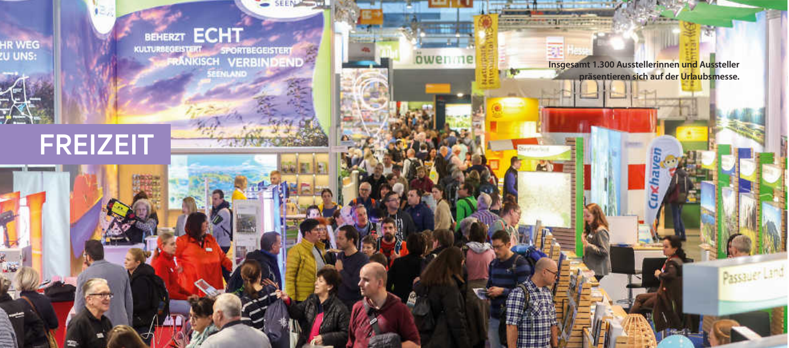
Insgesamt 1.300 Ausstellerinnen und Aussteller präsentieren sich auf der Urlaubsmesse.