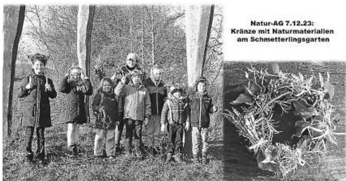
Natur-AG 7.12.23: Kränze mit Naturmaterialien am Schmetterlingsgarten

Im Dezember wanderten wir bei angenehmen Temperaturen zum Schmetterlingsgarten am Wurmberg . Das üppig vorhandene Naturmaterial nutzten wir, um wunderschöne Kränze zu flechten.