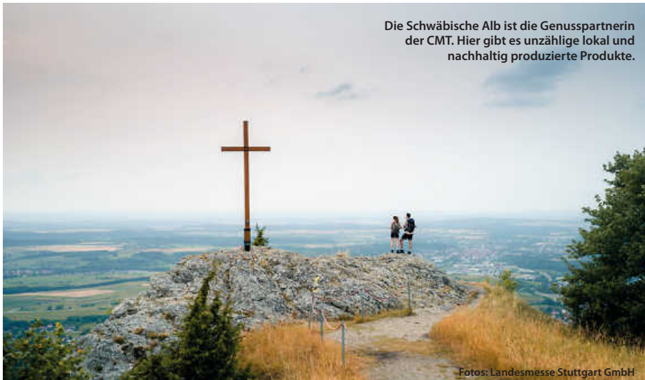
Die Schwäbische Alb ist die Genusspartnerin der CMT. Hier gibt es unzählige lokal und nachhaltig produzierte Produkte.

Auch das zweite CMT-Wochenende, vom 18. bis 21. Januar, hält für Aktiv-Urlauberinnen und Urlauber einiges bereit: In Halle 9 zeigen dann Ausstellerinnen und Aussteller, welche Reisen Sie zum Thema Golf, Wellness und Kreuzfahrten in petto haben. Zu entdecken gibt es also wahrlich vieles. (pm/red)