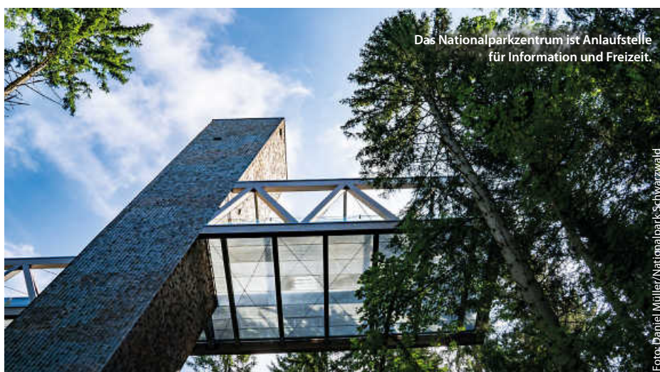
Das Nationalparkzentrum ist Anlaufstelle für Information und Freizeit.

Alles in allem ein echter Grund zum Feiern! „Über das gesamte Jahr wollen wir Bürgerinnen und Bürger bei Führungen und Veranstaltungen dazu einladen, den Nationalpark vor Ort und gemeinsam mit uns zu erleben. Wir wollen genau hinschauen, auf die großen und kleinen, die sichtbaren und verborgenen Veränderungen“, sagt Schlund voll Vorfreude auf ein volles Programm zum Jubiläumsjahr. (pm/red)