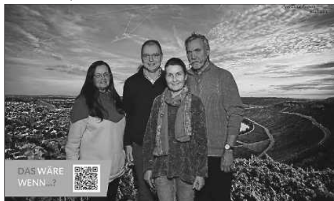
WIR aus Ingersheim und Pleidelsheim (Fotobox der Region)

Beteiligen Sie sich! Wenn sie es nicht tun, haben Sie die Chance verpasst.