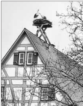
01.02.2024: Unsere Wiesentalstörche sind zurück!