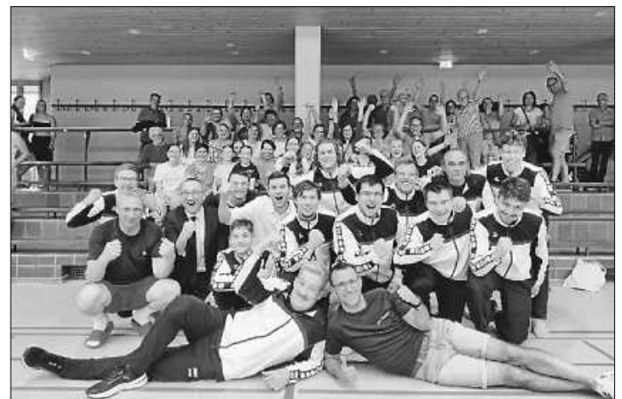
Die Mannschaft feiert den Klassenerhalt mit ihren Fans