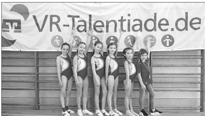
Die sechs TVI-Turnerinnen bei der VR-Talentiade