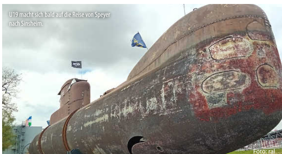
U19 macht sich bald auf die Reise von Speyer nach Sinsheim.

Und auch Tipps zur Freizeitgestaltung finden sich hier: Wie wäre es mit einem Relax-Tag in der Caracalla-Therme Baden-Baden, Action im Europa Park Rust oder einer Wissenstour in der Klima Arena Sinsheim? Möglichkeiten zum Heimat entdecken gibt es genug. Schauen Sie rein. (jr)