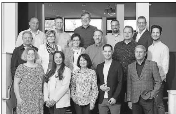
Super Team 2024

Mit einem sehr guten Team haben wir gegenüber 2019 nochmals zulegen können.