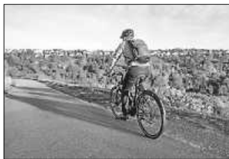
Auf dem Dienstrad wird der Weg zur Arbeit ein Vergnügen (Bildrechte: 2023 Ministerium für Verkehr Baden-Württemberg CC BY-SA.)

Mit dem Dienstrad-Leasing wird Mitarbeitermotivation und -gesundheit gefördert und gleichzeitig der CO 2 -Ausstoß reduziert. Dazu kommt die kostenneutrale und einfache Umsetzung des Rahmenvertrags. Deshalb sind Arbeitgeber immer häufiger bereit, ein Dienstrad zur Verfügung zu stellen. Sollte der eigene Arbeitgeber noch kein Fahrrad-Leasing anbieten, ist Initiative durch Arbeitnehmende gefragt – Arbeitgeber überzeugen und mit dem eigenen Dienstrad beim Stadtradeln antreten.